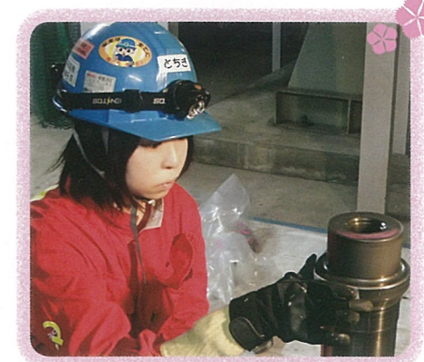
女性社員バルブメンテナンス作業中