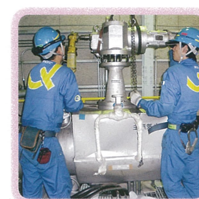
バルブメンテナンスの作業風景